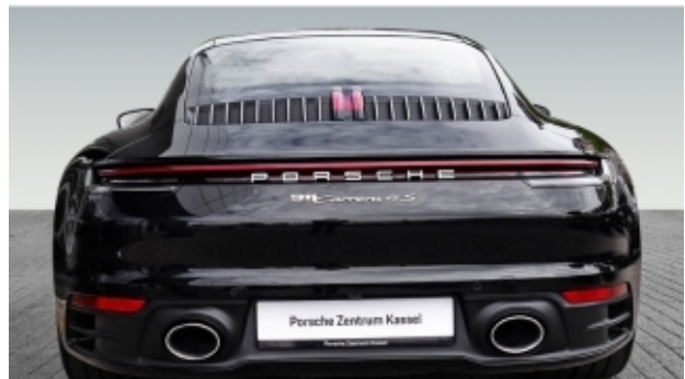
Porsche Zentrum Kassel