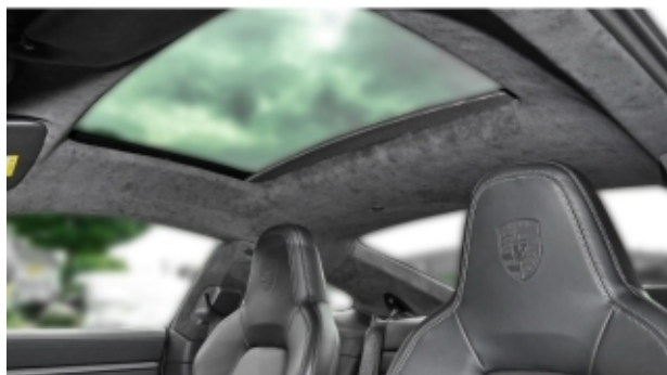
Porsche Zentrum Kassel