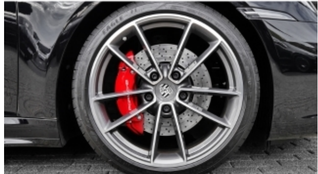
Porsche Zentrum Kassel