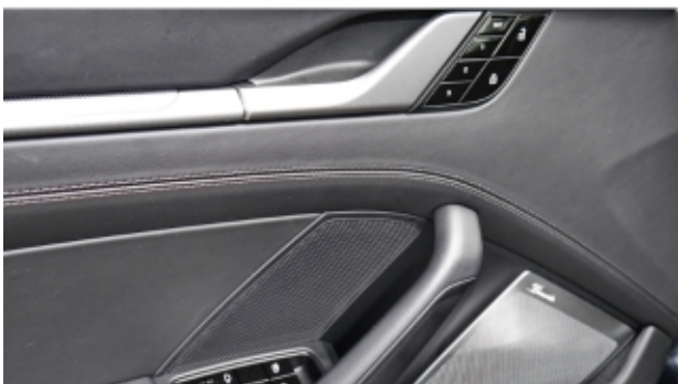
Porsche Zentrum Kassel