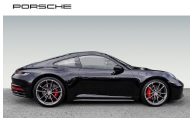
Porsche Zentrum Kassel