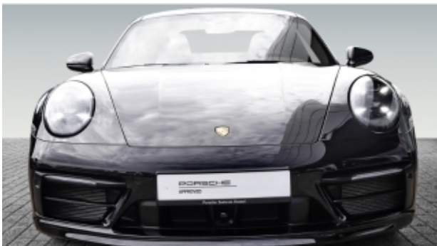
Porsche Zentrum Kassel