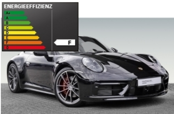
Porsche Zentrum Kassel