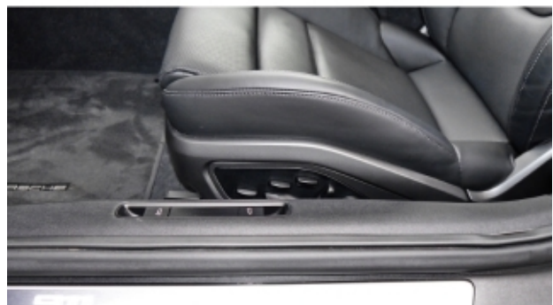
Porsche Zentrum Kassel