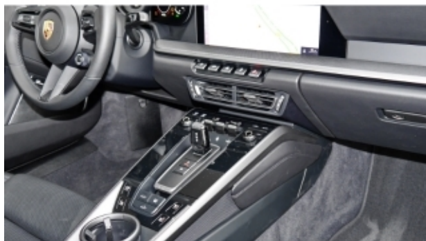
Porsche Zentrum Kassel