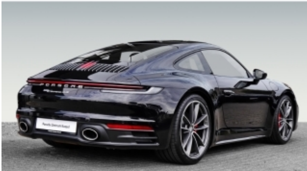
Porsche Zentrum Kassel