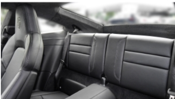
Porsche Zentrum Kassel