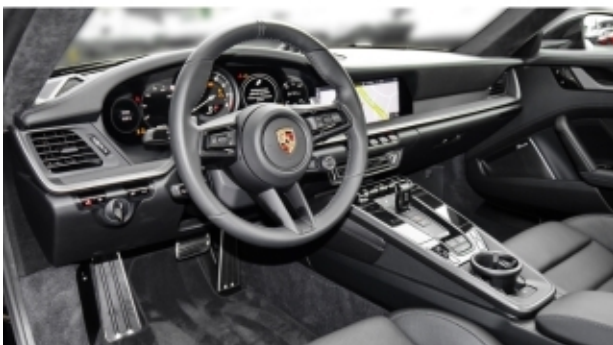
Porsche Zentrum Kassel